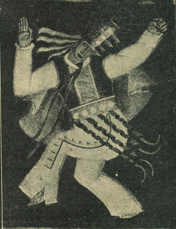
Вгорі, праворуч—роботи монументального ательє проф. Трояновського. Внизу—декоративне панно з сірого паперу (оформлення Варшавської художньої школи)