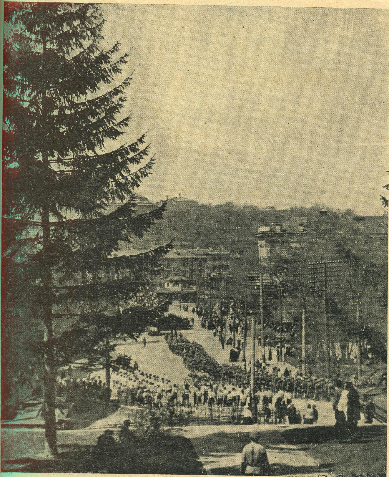
ПЕРШЕ ТРАВНЯ В КИІВІ